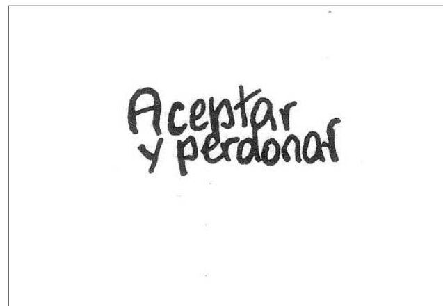
Ilustración de Elena Zambonini

Introducción al Millcayac. Idioma de los huarpes de Mendoza Pablo José Tornello y otros; Zeta Editores; 2011